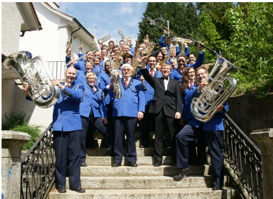
Die Harmonie Affoltern am Albis im Mai 2012 vor der Reformierten Kirche in Affoltern a.A.