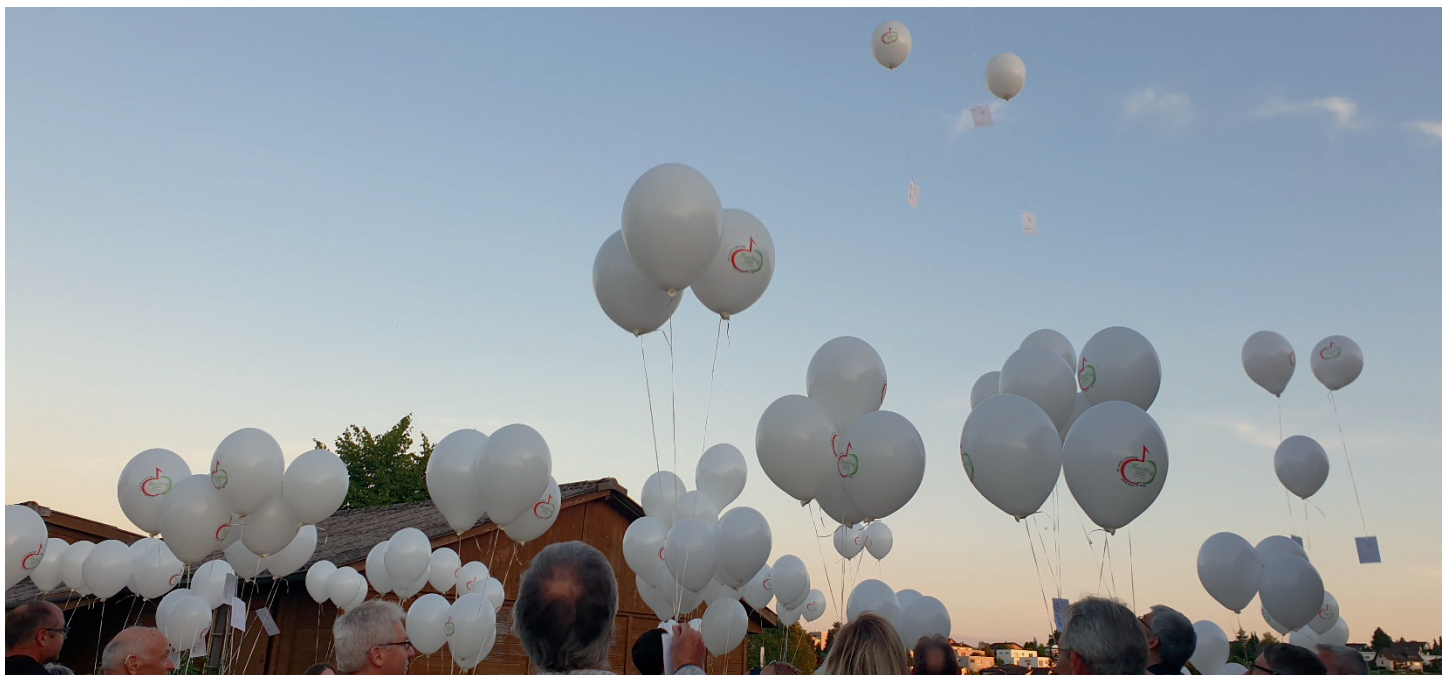
Die Mitglieder der Harmonie lassen anlässlich des Grillabends vom Juli 2020 die bestellten, aber nicht mehr benötigten Luftballone steigen